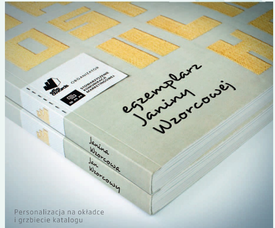
Personalizacja na okładce i grzbiecie katalogu

Pozwala ona bezpośrednio komunikować się z Klientem i przesłać propozycję stworzoną specjalnie dla Niego, a tym samym nawiązać z Nim trwałe kontakty. Ponadto wywołuje poczucie wyjątkowości u odbiorcy.