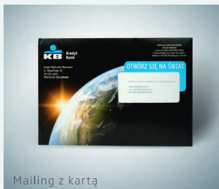
Mailing z kartą

Mailing klasyczny nadawany jest w kopertach o dowolnym kształcie i jest podstawą wielu kampanii marketingowych. Taka przesyłka zazwyczaj zawiera spersonalizowany list oraz materiały promocyjne typu ulotki, kupony, gifyt itp. Dbamy o to, aby każda kampania niosła ze sobą wysoki odzew Klientów .